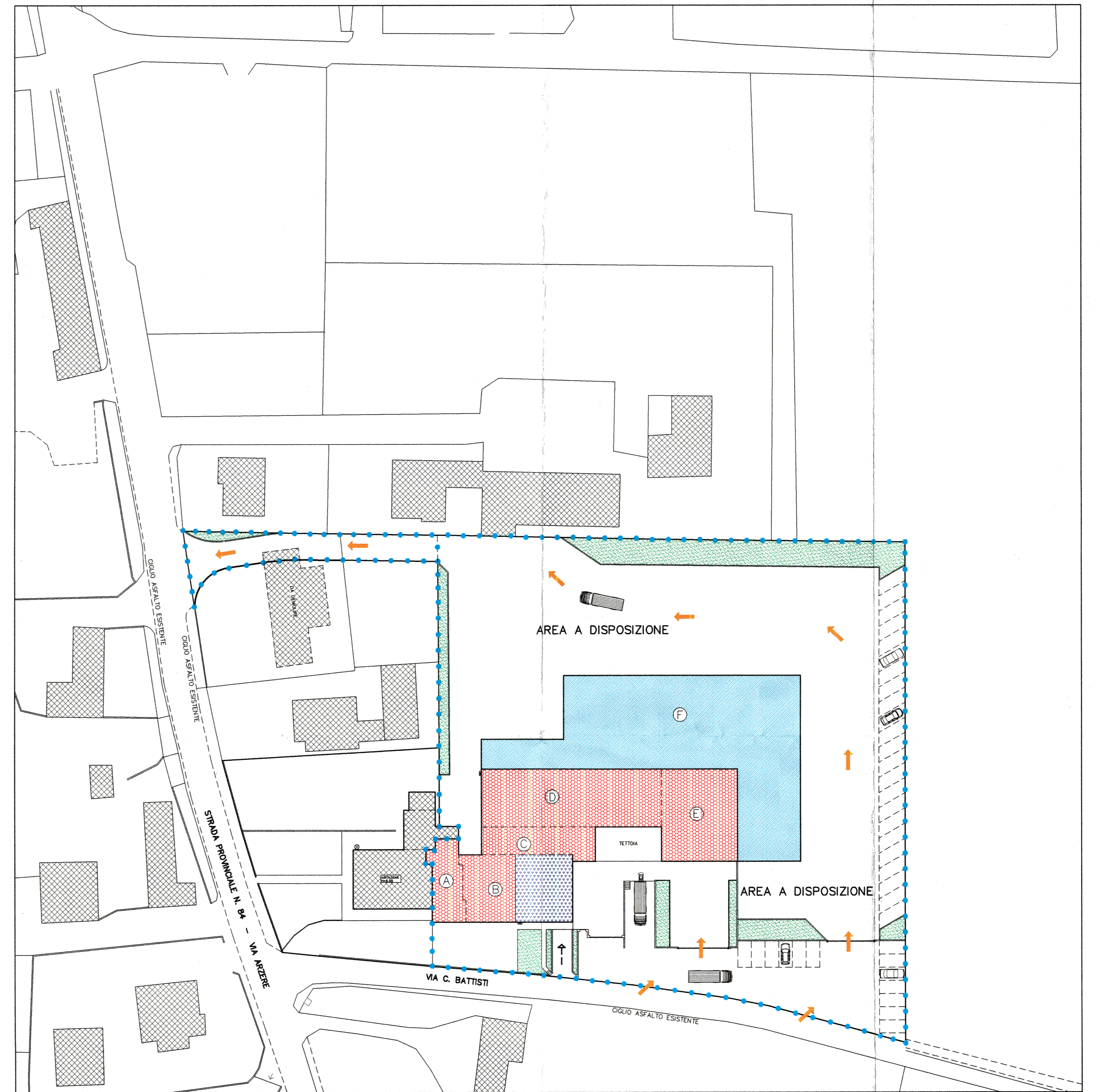
SVILUPPO A PROGETTO sc. 1:500 - Piano Terra